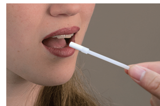
ze sběrače slin