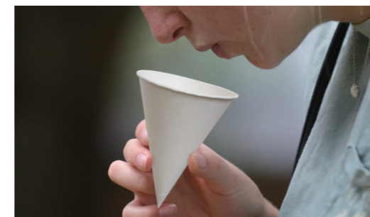
Ze slin odebraných do kelímku